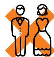
Uit elkaar gaan

Of het pensioen dat je later ontvangt voldoende is, hangt af van jouw wensen en je verwachte uitgaven. Het is daarom slim dit nu al op een rijtje te zetten.